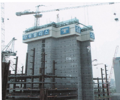
그림 7. Slip Form

슬립폼은 잭 로드(jack rod)에 의해 거푸집과 작업대 및 비계틀 등의 정하중을 활동 상승시키면서 철근과 콘크리트를 연속적으로 타설해 가는 1day사이클이 가능한 거푸집 시스템이다. 이 공법은 사일로(Silo), 전단벽(Diaphragm wall) 건물, 유틸리티코어(Utility Core), 교각 등과 같이 수직적으로 반복된 구조물이나 시공이 어렵지 않은 균일한 현상으로 시공되어야 하는 원