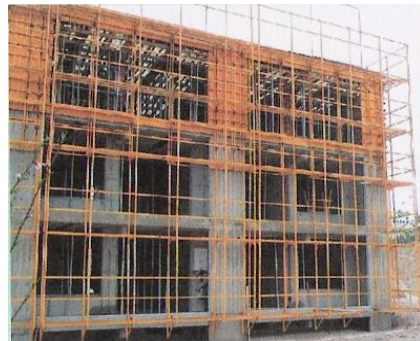
그림 5. Gang Form

기존 재래식 거푸집을 이용하여 콘크리트 타설 및 외부전출 부위의 작업을 할 경우에 안전작업을 위한 발판이 없어 이에 따른 안전사고를 방지하기 위한 비계를 별도로 설치해야 할 뿐만 아니라 골조공사 완료시까지 장기간 동안 기 설치한 비계의 이동이 불가능 한 점 등 많은 불편을 겪어 왔으나, 최근 스틸(Steel)을 사용한 갱폼(Gang Form)이 정확한 치수에 의해 공장 에서 정밀 제작되어 보급되므로 규격, 수평, 수직 및 평탄도가 완벽하여 정밀시공은 물론 해체 또한 용이하기 때문에 공기단축과 공사 품질 향상을 기할 뿐 아니라 기준층 설치 후 반복사용이 가능함으로써 기존 재래식 목재 거푸집보다 월등한 경제성이 있다.