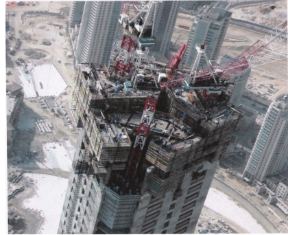
그림 4. A.C.S. Form

국내에서는 주로 ACS 100 Type R을 사용하고 ACS 100 Type R은 표준 타입의 자력 양중 시스템으로 거푸집 작업을 5.1m 높이까지 한 번에 할 수 있다.