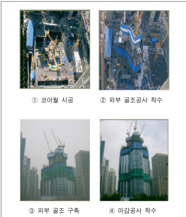
그림 3. 코어월 (A.C.S.)시공