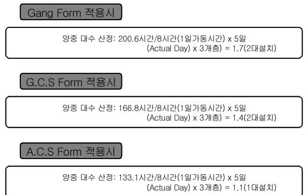
그림 8. T/C 양중량 분석

각 System Form의 양중 시스템은 골조공사 공기단축으로 인한 경제성을 창출할 수 있다. 표 6에 원가는 T/C 양중량 분석을 통한 원가 상승 수치이다. 그리고 그림 8은 System Form T/C 양중량 분석을 통한 양중대수 산정식이다.