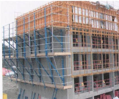
그림 6. Guide Rail Climbing System

적용되는 구조물은 고층 구조물의 측벽, 건물외부 구조물 설계가 발코니 등으로 비교적 거푸집 면적이 많게 설계된 부위에 적용하면 효과가 크다.