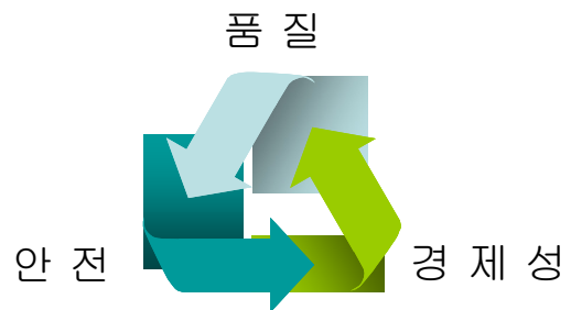
그림 2. 거푸집 공법의 예비적 고찰