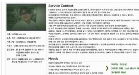
< 가상 인물(퍼소나) 설정 >