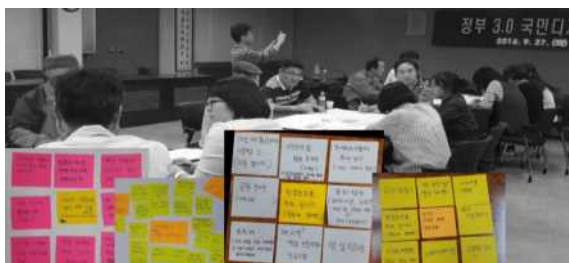
< 아이디어 개발 >