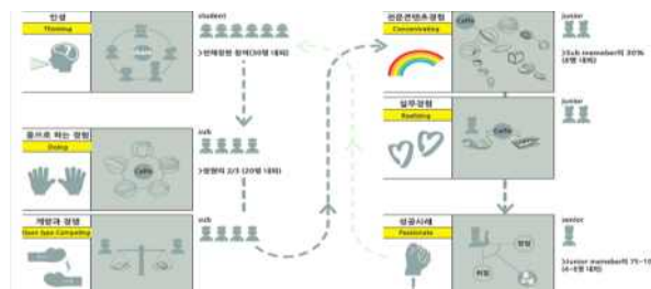
< 아이디어 스토리보드 구성 >