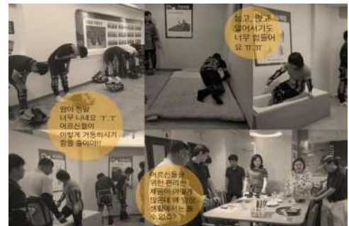
< 노인안전컬러를 위한 노인 체험 >